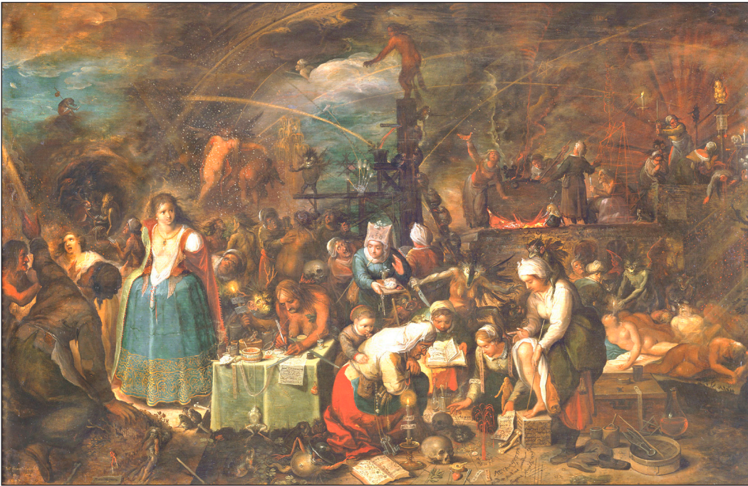
Frans Francken, Heksesamling (1607).