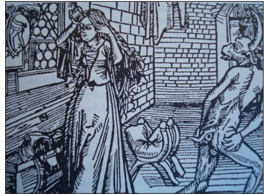
Kvinnelig forfengelighet og forføringkunst – Djevelens verk. Tresnitt fra 1498. Avfotografert fra Claudia Opitz: Der Hexenstreit. Frauen in der frühneuzeitlichen Hexenverfolgung (Freiburg, 1995), 101.

Och tilspurde hende 2 gange, Om hun wilde tienne Hannom, Huortil hun Suarit Ney, och meendte at en hun [sic] icke Kunde tale, Samme Dag Nogit der effter, Kom Fanden Jnd til hende, wdi en Mands Lignelße Som waar