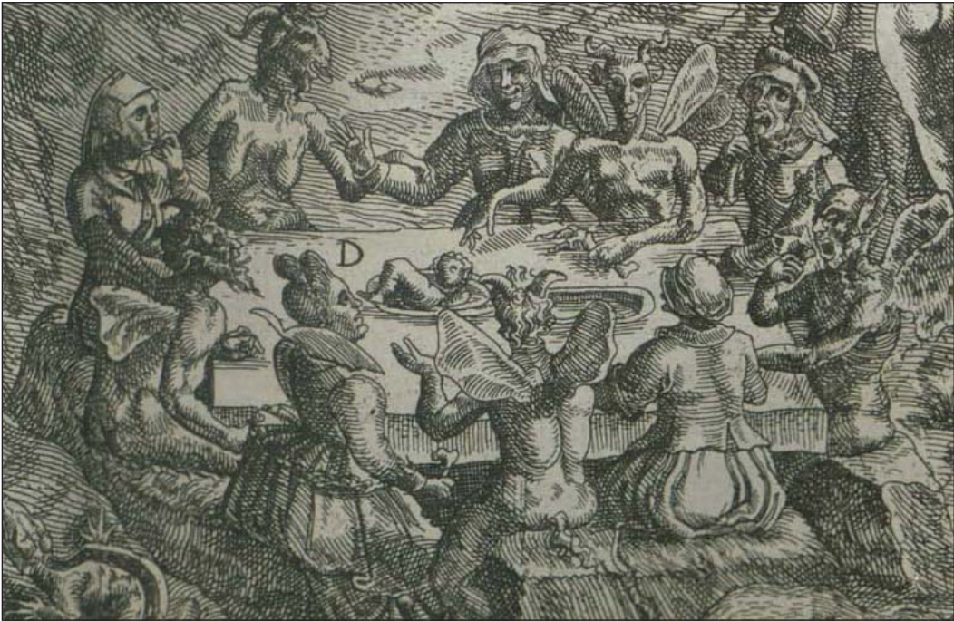
Jan Ziarnko, Heksenes bankett . Detalj fra Description et Figure du Sabbat des Sorciers i Pierre de Lancre, Tableau de l'inconsistance des mauvais anges (Paris, 1613).